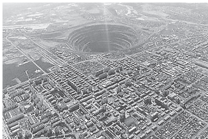
Abbildung 3: Division durch eine recht große Null.

Wenn ich beweisen kann, dass 2 = 1 ist, dann habe ich den logischen Super-GAU. Denn dann kann ich alles beweisen: dass ich der Papst bin, dass die Erde eine Scheibe ist, einfach jeden Unsinn. Um das zu vermeiden, wird die Division durch null illegalisiert.